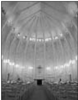
Kobe Shoin Women's University Chapel